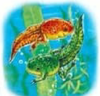
У пуголовків вирости лапки