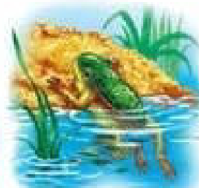
Жабеня виходить із води