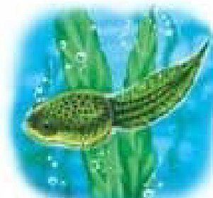
Пуголовок, що вилупилася з ікринки