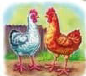
Молоді курочки на подвір'ї