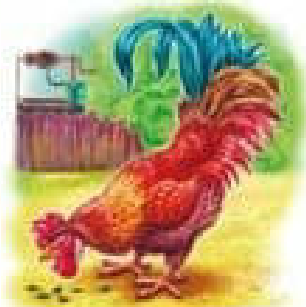
Паник дзьобав зернятка