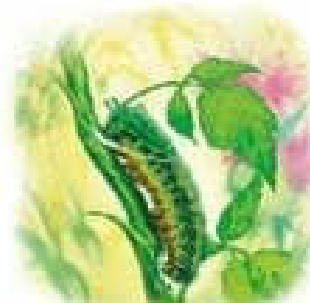
Гусениця перетворюється на палечку