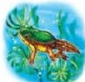
Пуголовок перетворилася на жабенятко з хвостиком