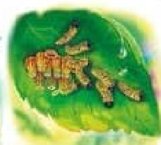
З яєчок вилуплюються гусениці