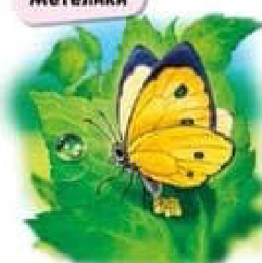
Метелик відкладає яєчка