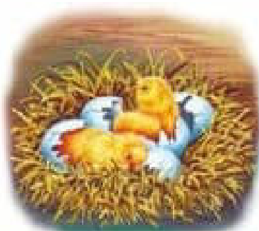
Курчата щойно вилупилися