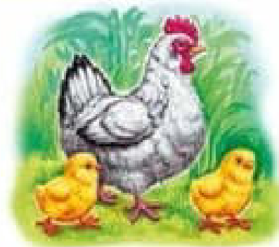
Курчата на прогулянці