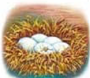
Курча прокльовується з яйця