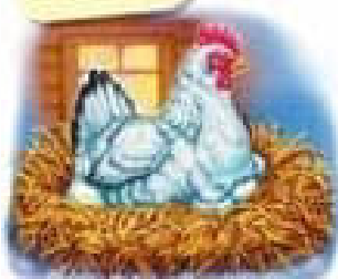
Курочка висиджує яйця