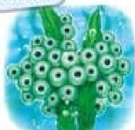
Ікринки жаби на водоростях